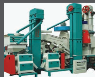
macchine di processo