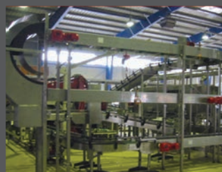
linee di produzione