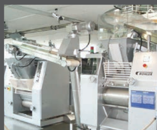
macchine per il confezionamento